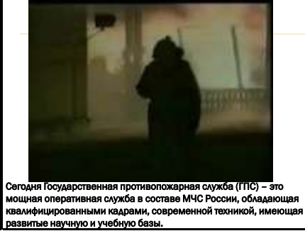
Сегодня Государственная противопожарная служба (ГПС) – это мощная оперативная служба в составе МЧС России, обладающая квалифицированными кадрами, современной техникой, имеющая развитые научную и учебную базы.