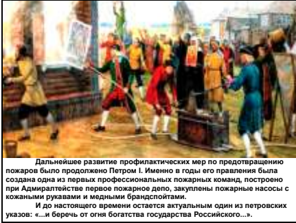
Дальнейшее развитие профилактических мер по предотвращению пожаров было продолжено Петром I. Именно в годы его правления была создана одна из первых профессиональных пожарных команд, построено при Адмиралтействе первое пожарное дело, закуплены пожарные насосы с кожаными рукавами и медными брандспойтами. И до настоящего времени остаются актуальным один из петровских указов: «...и беречь от огня богатства государства Российского...».