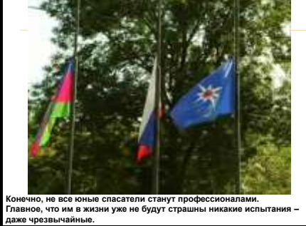
Конечно, не все юные спасатели станут профессионалами. Главное, что им в жизни уже не будут страшны никакие испытания – даже чрезвычайные.